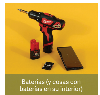
Baterías (y cosas con baterías en su interior)