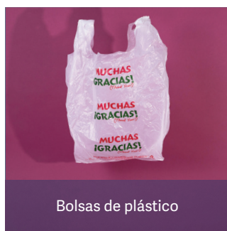
Bolsas de plástico