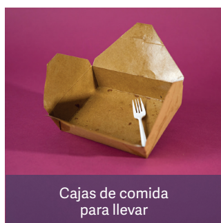
Cajas de comida para llevar