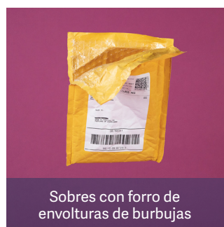
Sobres con forro de envolturas de burbujas