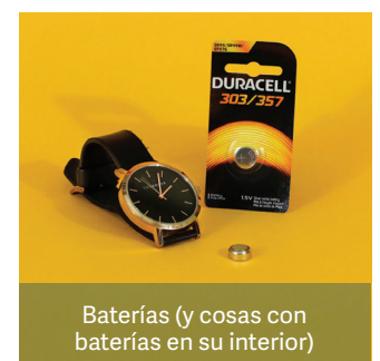
Baterías (y cosas con baterías en su interior)