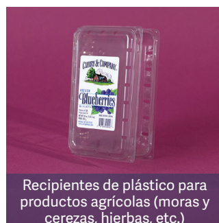
Recipientes de plástico para productos agrícolas (moras y cerezas, hierbas, etc.)