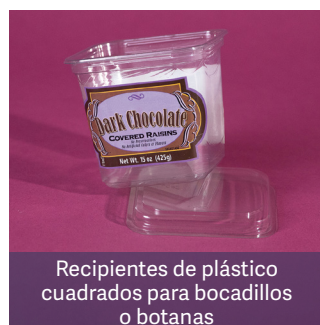
Recipientes de plástico cuadrados para bocadillos o botanas