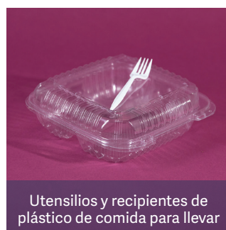
Utensilios y recipientes de plástico de comida para llevar