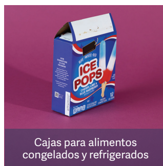
Cajas para alimentos congelados y refrigerados