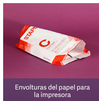
Envolturas del papel para la impresora