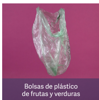
Bolsas de plástico de frutas y verduras