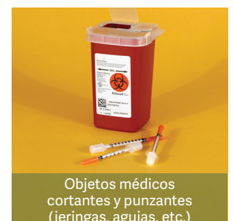
Objetos médicos cortantes y punzantes (jeringas, agujas, etc.)