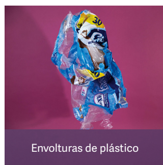
Envolturas de plástico