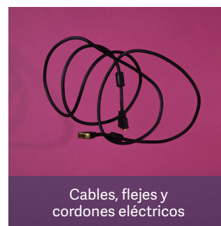
Cables, flejes y cordones eléctricos