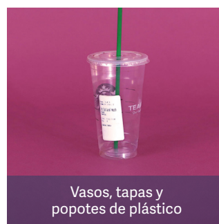
Vasos, tapas y popotes de plástico