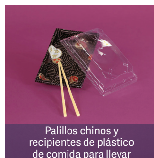
Palillos chinos y recipientes de plástico de comida para llevar