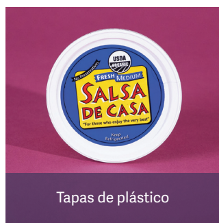
Tapas de plástico