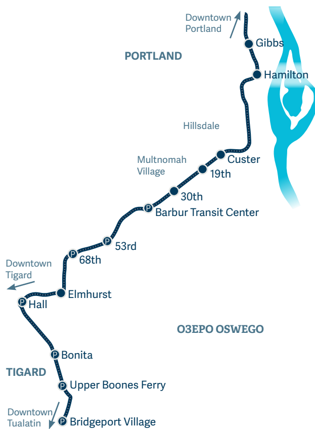
Предложенная трамвайная линия в Southwest Corridor