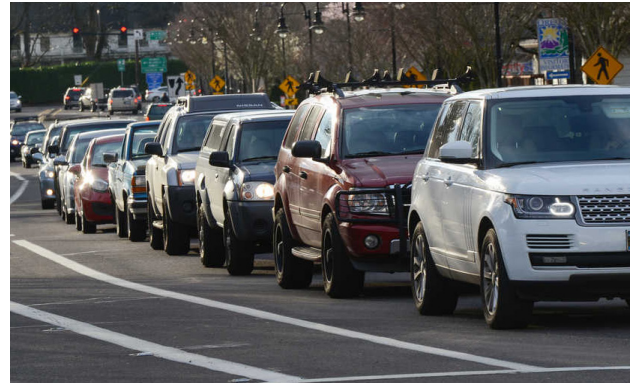
Las comunidades del suroeste están creciendo, lo que aumenta la presión en las calles, el transporte público y los senderos.